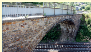
Pons delicti: Die Brücke in der Gartenstraße in Niederdielfen.

Zukünftige Generationen werden ihr vernichtendes Urteil über so viel Ignoranz, kleinkarierte Klientelpolitik und Wählertäuschung sprechen: In Niederdielfen wird eine Brücke über die Bahnlinie abgerissen und neu gebaut, die dem Autofahrer einen Vorteil von etwa 2 Minuten bringt. Gegen alle guten Argumente aller anderen Parteien hat die Mehrheitsfraktion dies durchgeboxt, und das, obwohl auch eine Fußgängerbrücke gereicht hätte. Mehrere Hunderttausend € hätten so gespart werden können, von den jährlichen Folge- und Unterhaltungskosten ganz zu schweigen. Und das alles auf Pump. Da frage noch jemand, wer die Millionen von Schulden in Wilnsdorf der vergangenen Jahrzehnte zu verantworten hat. Unserer Meinung nach hätte die Bürgermeisterin diesen Beschluss nicht umsetzen dürfen, um Schaden von der Gemeinde abzuwenden. (rima)