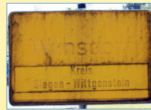
Fotografiert in der Dortmunder Straße

Diese Frage mussten wir uns stellen, nachdem bekannt wurde, dass an dem vom Kreis Siegen-Wittgenstein ausgerichteten Wettbewerb „Unser Dorf hat Zukunft“ kein Wilnsdorfer Ortsteil teilgenommen hat. Dieses Detail untermauert unsere seit Jahren bestehende Forderung, die aus den 80iger Jahren stammenden Bestandsaufnahmen zur Dorfentwicklung endlich im Hinblick auf den demographischen Wandel weiter zu entwickeln. Wir brauchen fundierte und tragfähige Dorfentwicklungskonzepte, die Auskunft darüber geben, wie unsere Dörfer für Jung und Alt ihre Attraktivität behalten. Läden, Dienstleistungsangebote, Kindergärten, Friedhöfe, intakte Straßen und Infrastruktur müssen auch in Zukunft vorhanden sein, damit Menschen hier wohnen können und wollen. Dies kann nicht von Fall zu Fall aus dem hohlen Bauch heraus entschieden werden, sondern braucht ein Konzept aus einem Guss. Unsere Fraktion wird hier am Ball bleiben. Damit unser Dorf eine Zukunft hat.