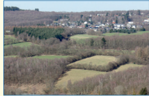
Rinsdorfer Weidekampen schützenswert? Windschutzhecken, die keine mehr sind.

Unsere Fraktion stimmte als einzige im Rat der Gemeinde Wilnsdorf und im Kreistag gegen die Aufstellung des Landschaftsplanes für Wilnsdorf, weil wir die Einschränkungen für die Grundstückseigentümer für unverhältnismäßig und unzumutbar halten. Das sog. Umbruchverbot für Grünlandflächen ist eine nicht hinnehmbare Gängelung. Auch die Unter-„schutz“-stellung des gesamten Rinsdorfer Weidekampen, obwohl nur die Windschutzhecken schützenswert sind, (und selbst das ist noch fraglich) halten wir für willkürlich. Es geht scheinbar nur darum, möglichst viele Hektar zusammen zu bekommen, um den Vollzug nach Arnberg melden zu können. Uns Liberalen bedeutet das Recht auf Eigentum sehr viel. Es sollte nicht bürokratischen Spielchen geopfert werden. Außerdem besteht rechtlich gar keine Pflicht mehr, einen Landschaftsplan aufzustellen! Eine Tatsache, die die Zustimmung der anderen Parteien noch unverständlicher erscheinen lässt. (rima)